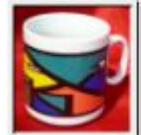
KAKAO – SCHOKOLADE